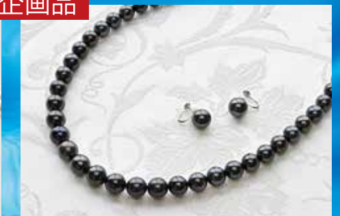
黒蝶真珠ネックレス・イヤリングセット