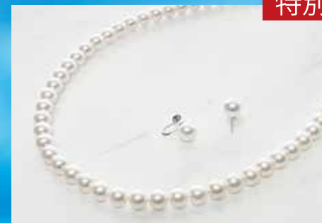
アコヤ真珠ネックレス・イヤリングセット ネックレス：8.0mm イヤリング：8.0mm